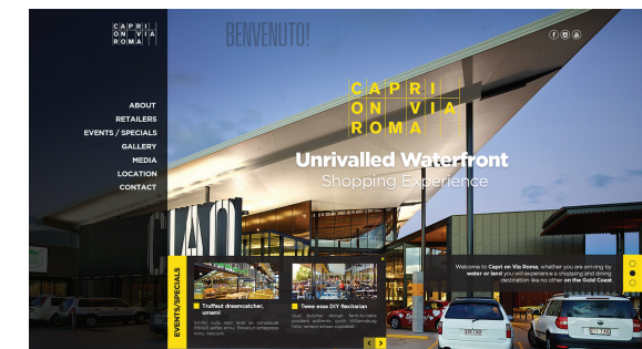
Die Kante des Gebäudes bildet in diesem Webdesign eine atemberaubende visuelle Linie. Via Hitron